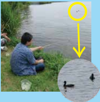
釣りを始めたところ、2羽のオオバンが近づいて来ました。釣りをしながら野鳥観察ができました。