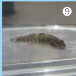
⑨ 仕掛けに入っていたヨシノボリの仲間 顔の赤い線が特徴