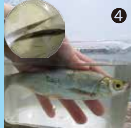
④ 18 cm位のワタカ 自然分布は琵琶湖・淀川水系 移入により手賀沼にも生息