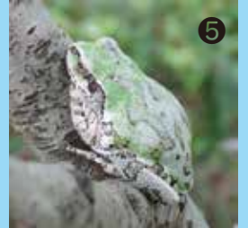
⑤ 体の色を変えるのが得意なニホンアマガエル