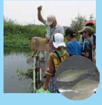
朝、仕掛けておいた「もんどり」をみんなで引き上げてみると、数種類の魚が入っていました。（右下写真はタイリクバラタナゴ）