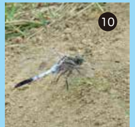
⑩ 斜面におりたシオカラトンボ コフキトンボに似ている