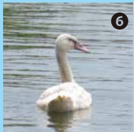
⑥ 今年生まれのコバク 成鳥に比べてまだ小さい