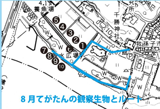
8月てがたんの観察生物とルート