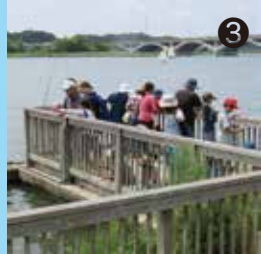
③ 手賀沼で釣りをする皆さんてがたんで初めて釣りに挑戦