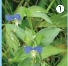
① 暑い時期（6～9月）に咲くツククサ