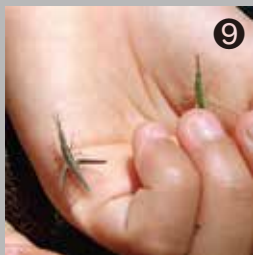
⑨ 水田でみつけた色が違うオンブバッタ