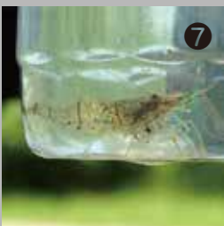
⑦ フジ棚近くの水辺で見つけたスジエビ