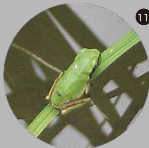
ニホンアマガエル

観察会で一番多くみられたカエルです。オタマジャクシから変態途中の個体もみられました。