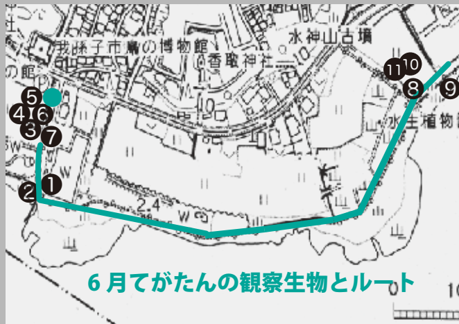
6月てがたんの観察生物とルート

観察会で一番多くみられたカエルです。オタマジャクシから変態途中の個体もみられました。