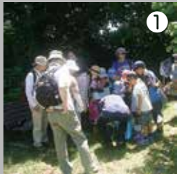
① カエルの生態について説明