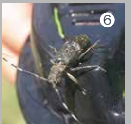
⑥ 水田近くでみつけたセンノカミキリ