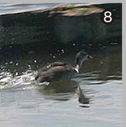
⑧ 手賀沼で観察したオオパンの幼鳥