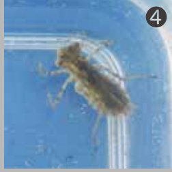
④ 水田でみつけたヤゴ (アキアカネまたはナツアカネ?)