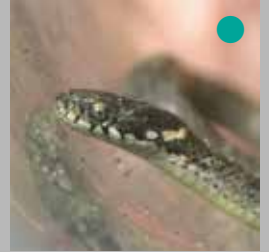
参加者の方が家の庭で見つけたヒバカリの幼蛇