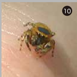
⑩ フジ棚でみつけたヒメカラスハエトリ