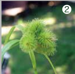
② 手賀沼でみつけたジョウロウスゲ