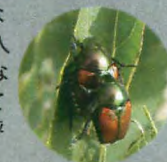
交尾するマメコガネ

植食性の昆虫は、食草食樹を限定しているものと、幅広く食べるものに分けられます。マメコガネの成虫は様々な植物を食べる代表的な甲虫です。アメリカに侵入したマメコガネは、その食性の広さと天敵がいないうちも相まって、農作物に大きな被害を与えています。アメリカではジャパニーズ・ビートルと呼ばれ、厄介者扱いされています。