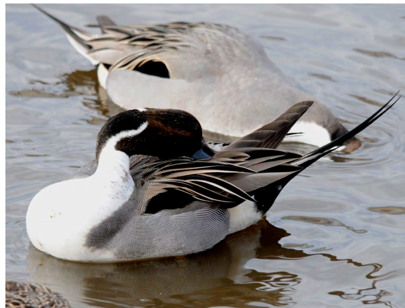
尾脂腺(びしせん)にくちばしをつけるオナガガモの♂。