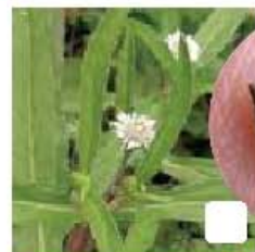
アメリカタカサブロウ