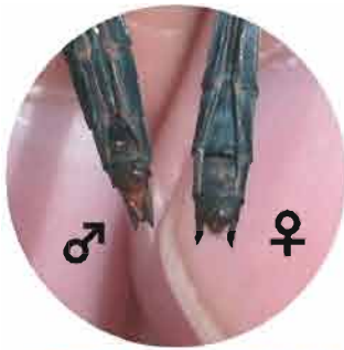
↑アキアカネの尾部の先端

トンボの交尾は少し特殊で、まずオスは自分の腹部の先端でつくった精子を腹部の前部にある貯精のうに移します。メスはオスと連結すると、腹部の先端にある生殖弁をオスの貯精のうにつけて、精子を受け取ります。