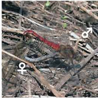
交尾中のアキアカネ

秋になると連結飛行をするトンボの姿をよく見かけるようになります。前がオス、後ろがメスです。オスは腹部の先端にある尾部付属器をメスの頭部の付け根につけて連結飛行をします。