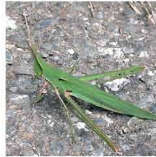
ショウリョウバッタ