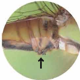
↑アキアカネのオスの貯精のう