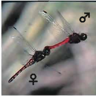
連結飛行するアキアカネ

秋になると連結飛行をするトンボの姿をよく見かけるようになります。前がオス、後ろがメスです。オスは腹部の先端にある尾部付属器をメスの頭部の付け根につけて連結飛行をします。