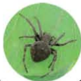
●葉の表や裏にいるクモを探す