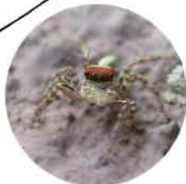
●ハエトリグモの仲間の 前向きについた目