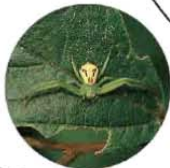
●カニグモの仲間の横歩き