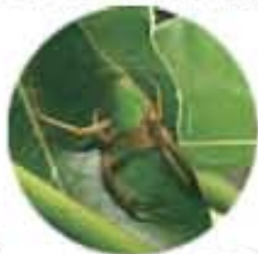
●サツマノミダマシの鮮やかな緑色