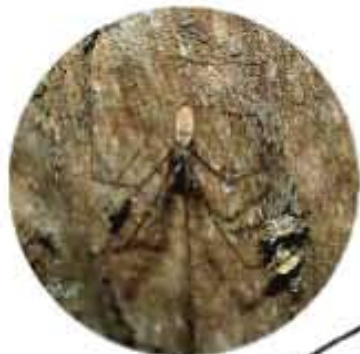
●ユウレイグモの仲間のユラユラ動く姿