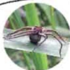
●卵のうを運ぶクモ