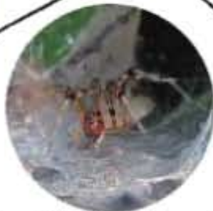
●タナグモの仲間の巣の間取り