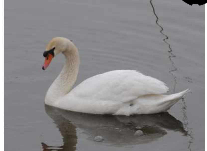
▲鳥インフルエンザにより死亡例のあるコブハクチョウ

2016年から2017年の冬は、全国各地で高病原性の鳥インフルエンザの発生が確認されています。現在国内で確認されているウイルスは、鳥から人に感染する可能性の低いものですので、通常通り鳥を見に行ったりするのは問題ありません。もし鳥の糞や死体に触った場合は手洗いをしましょう。