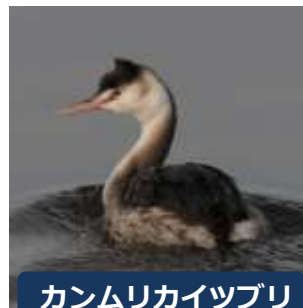
カンムリカイツブリ

沼の水面には渡ってきたカモ、カイツブリ、カモメの仲間が多く見られます。ミサゴやハヤブサなど、水辺を好む猛禽類も時々見られます。