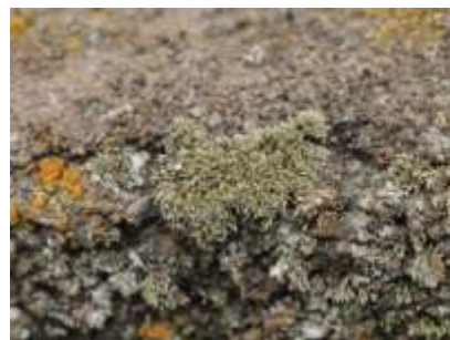
▲隣り合って育つ蘚類と地衣類

地衣類 (ちいるい) は藻類と菌類が共生している生物です。菌類は藻類が光合成で作った栄養をもらい、藻類は生育する場所を提供されていて、互いに利益があると考えられています。木の上やコンクリート上など、さまざまな場所で見られる地衣類を探してみましょう。