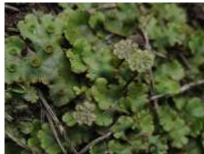
▲ゼニゴケの仲間の雄株