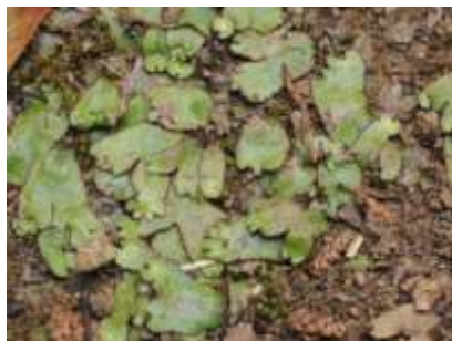
▲ゼニゴケの仲間 (苔類)