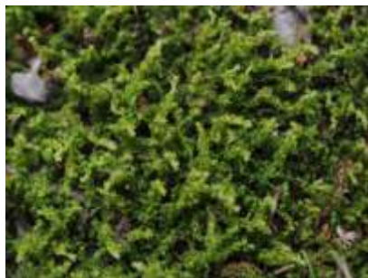
▲ミズゴケの仲間 (蘚類)

てがたんコースでは、コケ植物のうち苔類と蘚類の2つのグループが見られます。苔類では全体が平たい葉の様な形状をしています。蘚類では茎と葉がはっきりと区別できる形状です。