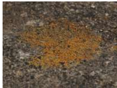
▲ブロック塀の上の地衣類

地衣類 (ちいるい) は藻類と菌類が共生している生物です。菌類は藻類が光合成で作った栄養をもらい、藻類は生育する場所を提供されていて、互いに利益があると考えられています。木の上やコンクリート上など、さまざまな場所で見られる地衣類を探してみましょう。