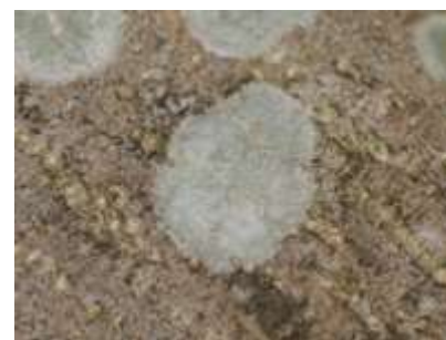
▲木の幹で生育する地衣類