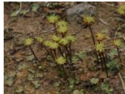
▲ゼニゴケの仲間の雌株

コケの仲間は基本的に孢子で増えます。交配には水によって孢子が運ばれる必要があるため、湿った場所を好みます。また、栄養生殖といって、クローンで増えることもできます。