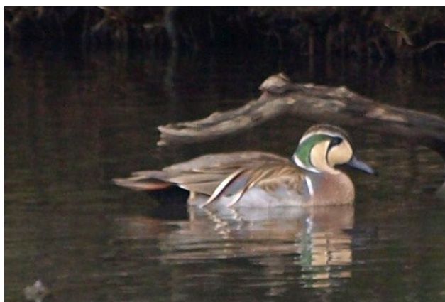
図 3. トモエガモ Anas formosa ♂ (2012年2月26日) Fig. 3. A male Bikal Teal Anas formosa (21 Feb. 2012.)