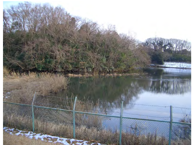
図 1. 千葉市千城台野鳥観察園 (2013 年 1 月 16 日、撮影：和仁道大)

千葉市千城台野鳥観察園において、2012 年 2 月 21 日から 3 月 5 日までの間、トモエガモ Anas formosa の雄 1 個体を確認した。千城