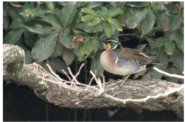
図 4. トモエガモ Anas formosa ♂ (2012年3月3日、撮影：坂本文雄) Fig. 4. A male Bikal Teal Anas formosa (3 Mar. 2012. Photo by Fumio Sakamoto)