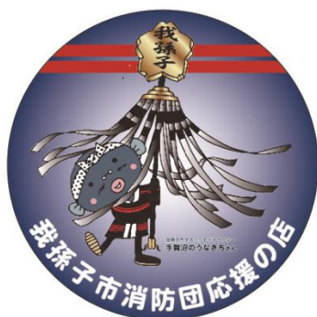
応援の店に貼っていただく 表示証（ステッカー）